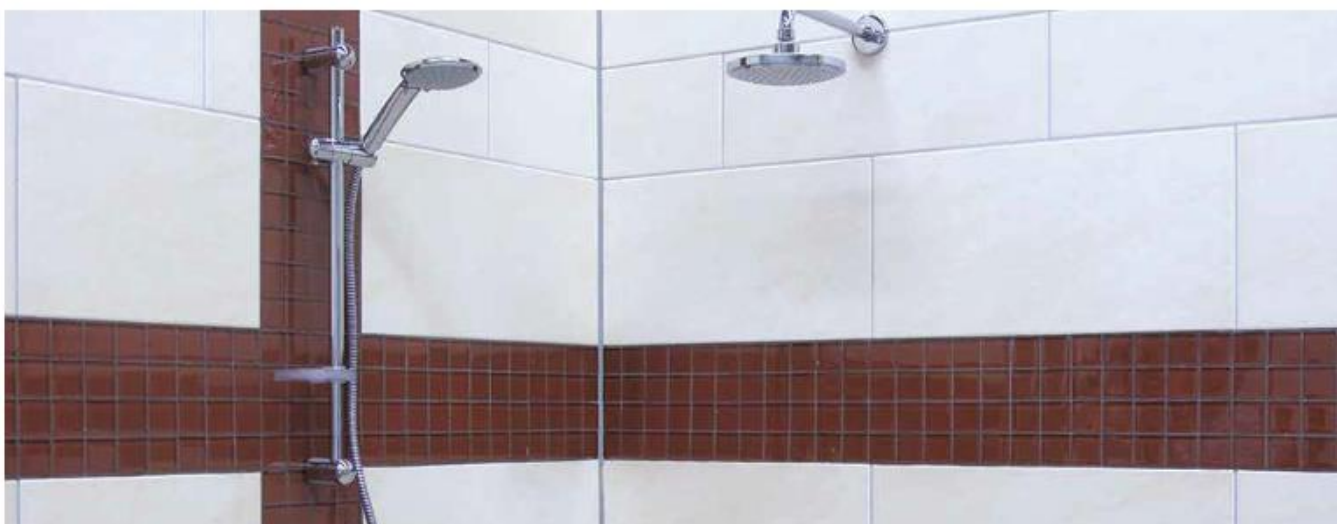
11 Okładzina w łazience zaspoinowana fugą Sopro DF 10®.