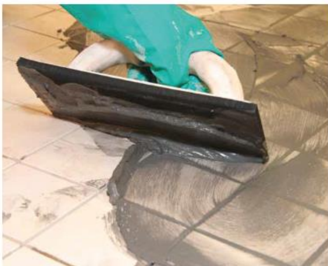
7 Spoinowanie płytek gresowych Design Fugą Flex Sopro DF 10®.