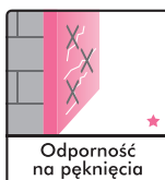
Odporność na pęknięcia